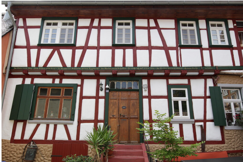
Die Fassade des Wohnhauses der Hofanlage Naheweinstraße 38 in Laubenheim (2021)