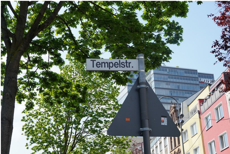
Straßenschild "Tempelstraße" in Köln-Deutz (2022)