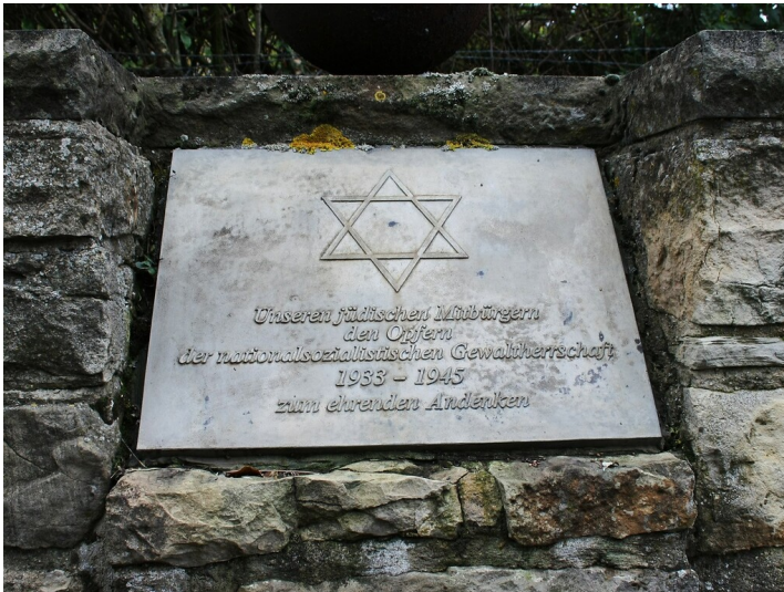
Gedenktafel zur jüdischen Gemeinde in Nideggen-Embken und die jüdischen Opfer der NS-Herrschaft am Rande des Dorfplatzes (2010).