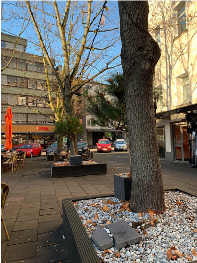
Der Jean-Claude-Letist-Platz in Köln-Altstadt-Süd (2021)