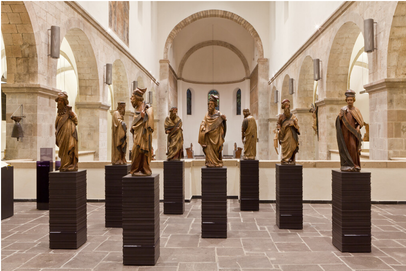
Innenansicht des Stifts St. Cäcilia in der Kölner Altstadt-Süd, heute Sitz des städtischen Museums Schnütgen für mittelalterliche Kunst (2012). Zu sehen ist die Figurengruppe der sogenannten "Rathauspropheten."