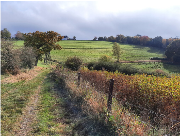
Die Wiese im Hintergrund wird von hangparallelen, alten Ackerterrassen durchzogen. Sie zeigen eine historische ackerbauliche Nutzung an (2021).