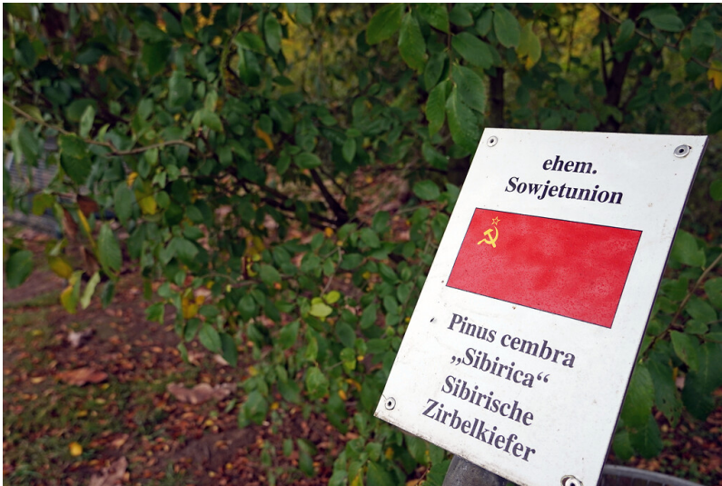
Schild von einem Gewächs aus dem Gebiet der ehemaligen Sowjetunion im Friedenswald in Köln-Rodenkirchen (2021). Die Schilder im Friedenswald werden bewusst auf dem Stand der diplomatischen Beziehungen der Bundesrepublik Deutschland im Jahr 1980 gehalten.