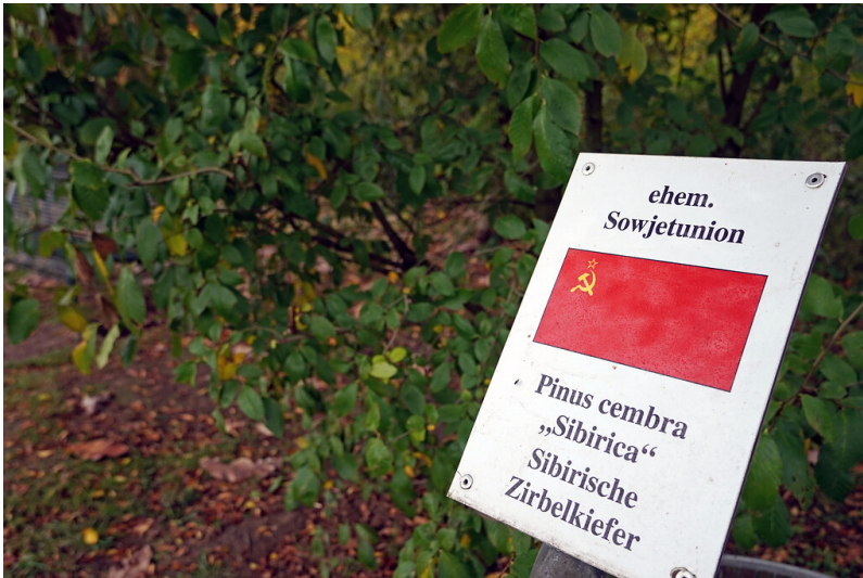
Schild von einem Gewächs aus dem Gebiet der ehemaligen Sowjetunion im Friedenswald in Köln-Rodenkirchen (2021). Die Schilder im Friedenswald werden bewusst auf dem Stand der diplomatischen Beziehungen der Bundesrepublik Deutschland im Jahr 1980 gehalten.