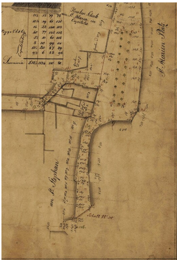
Ausschnitt aus der Brouillon-Karte von 1828, "Stadt Cöln, Blatt No. 31" mit der Straße "an St. Stephan" (heute Stephanstraße) und dem "St. Marien Platz" (Marienplatz); in der geosteten Ansicht ist Norden links im Bild.