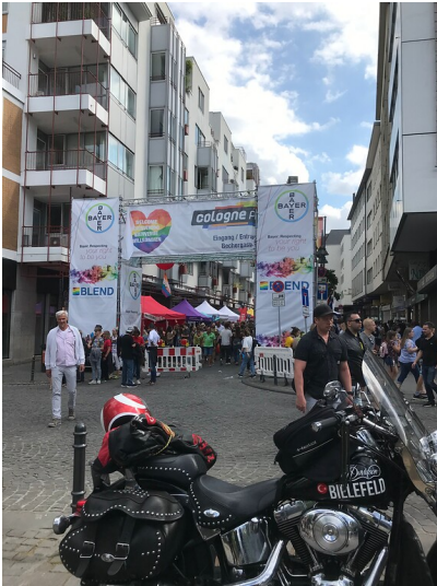
Der Christopher-Street-Day in Köln (2019)