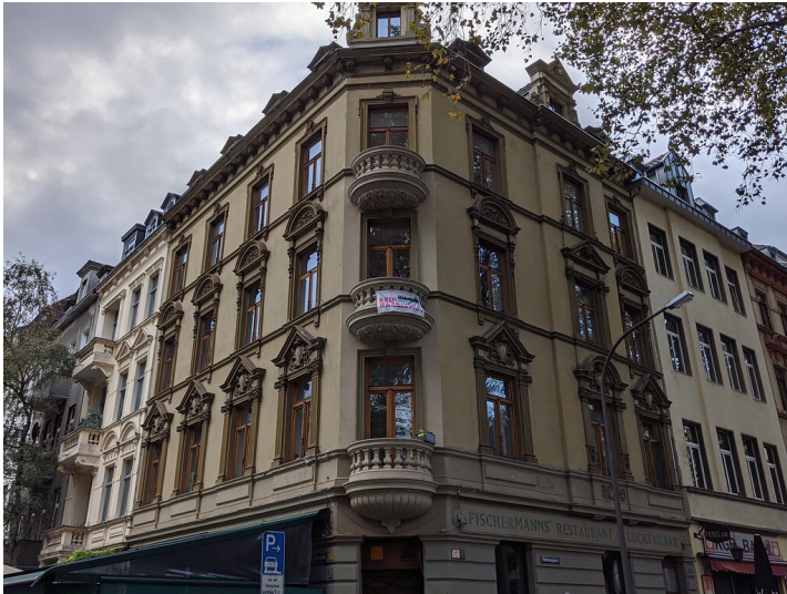
Historisches Gebäude am Rathenauplatz in der Kölner Neustadt-Süd (2021).