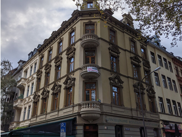
Historisches Gebäude am Rathenauplatz in der Kölner Neustadt-Süd (2021).