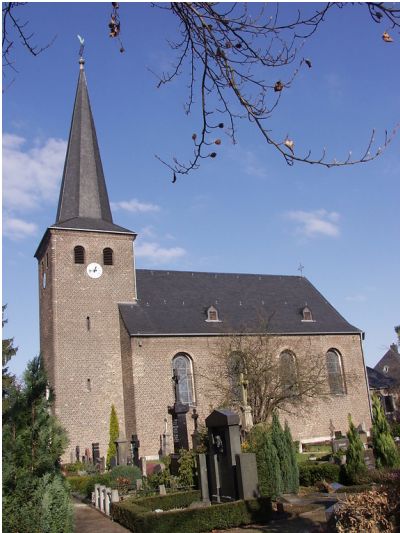
Die Katholische Pfarrkirche Sankt Jakobus in Köln-Widdersdorf (2003).