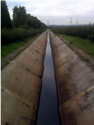
Der Kölner Randkanal in Köln-Lövenich (2012)