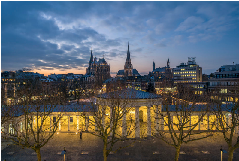
Elisenbrunnen in Aachen (2015)