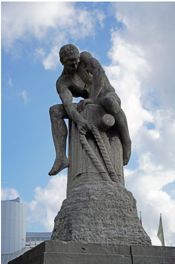
Detailaufnahme des oberen Teils des Denkmals "Der Tauzieher" in Köln-Altstadt-Süd (2021)