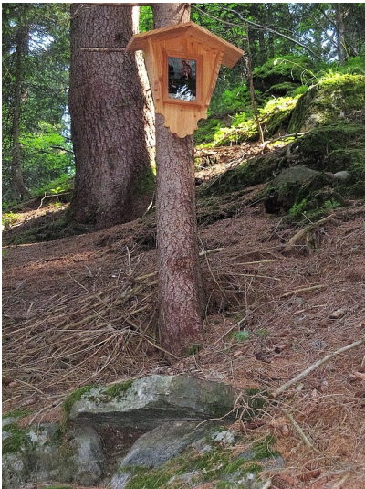
Bildstock am Alpweg Netza in Gortipohl (2015)