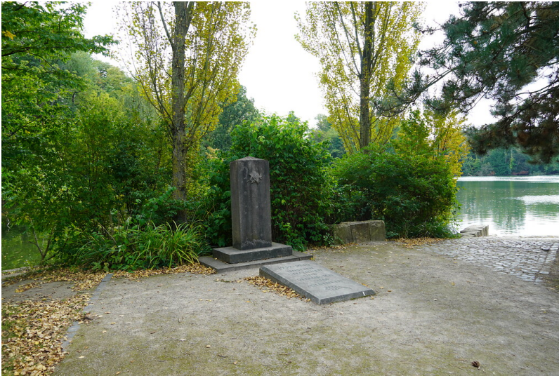
Blick auf das Kriegsdenkmal im Stadtwald in Köln-Lindenthal (2021).