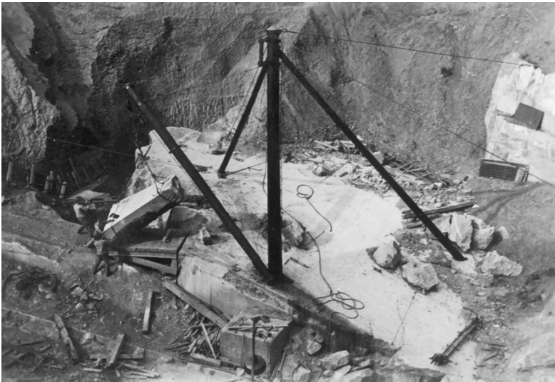
Historische Aufnahme der Bergung eines Blocks im Steinbruch Wirbelau