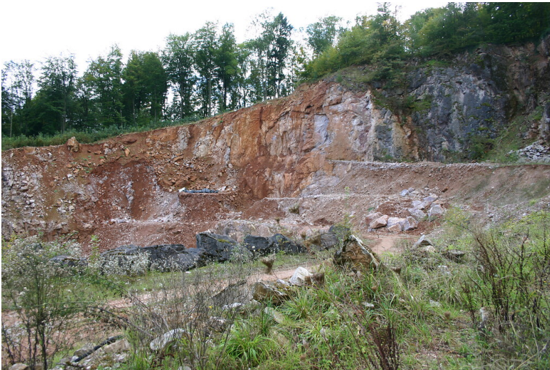
Lahnmarmorsteinbruch "Rote Kaut" in Schupbach (2007)