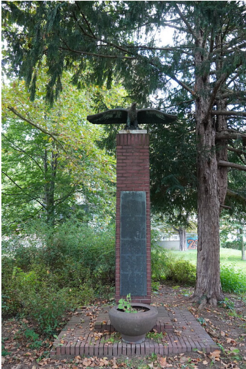
Denkmal an die Opfer des Zweiten Weltkriegs am "Zeppelin-Plätzchen" in Köln-Weiden (2021).