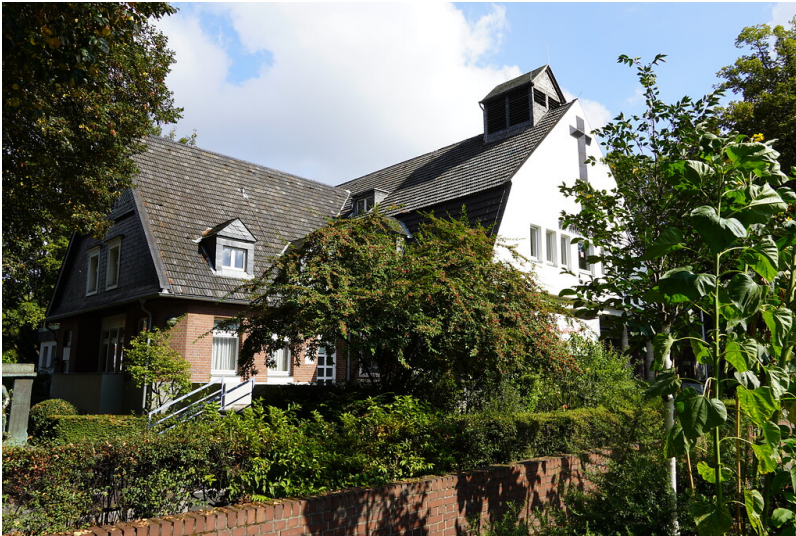
Die evangelische Kirche Jochen-Klepper-Haus an der Aachener-Straße in Köln-Weiden (2021)