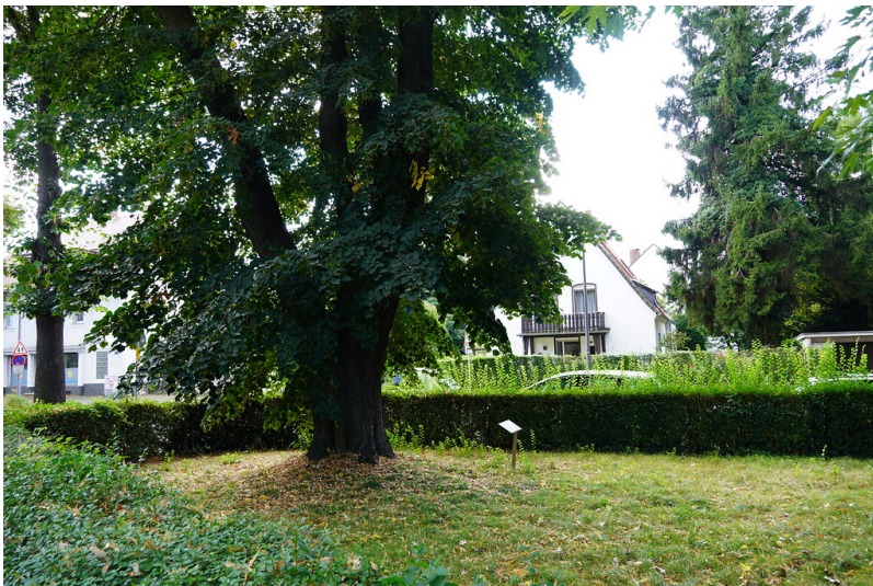
Die Zeppelin-Linde an der Ecke Eichendorffstraße / Schillerstraße / Bahnstraße in Köln-Weiden (2021).