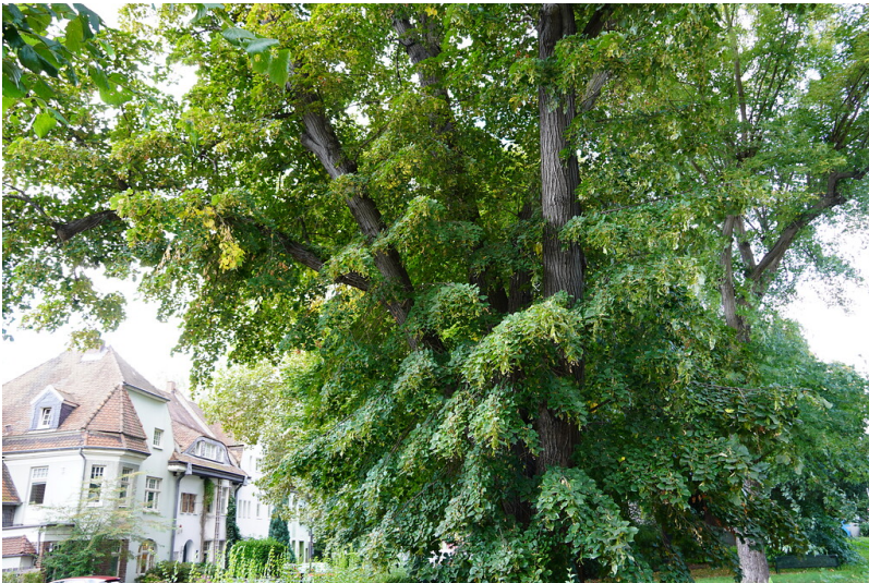
Blick auf die Zeppelin-Linde mit Altvillenbestand in der Eichendorffstraße im Hintergrund in Köln-Weiden (2021).