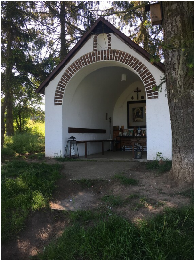
Josefskapelle (Marienkapelle) bei Koblenz-Lay (2021)