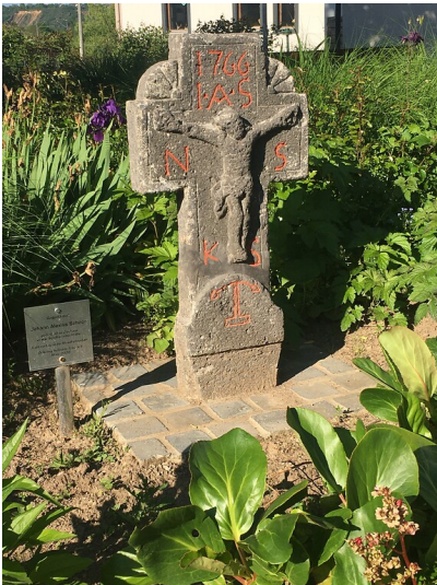
Gedenkkreuz Schoor auf dem Mostertplatz Koblenz-Lay (2021)

Schlagwörter: Gedenkkreuz Fachsicht(en): Landeskunde Gemeinde(n): Koblenz Kreis(e): Koblenz Bundesland: Rheinland-Pfalz