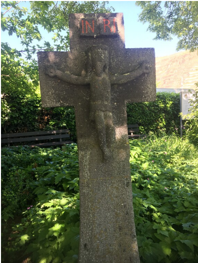
Bootskreuz auf dem Mostertplatz Koblenz-Lay (2021)