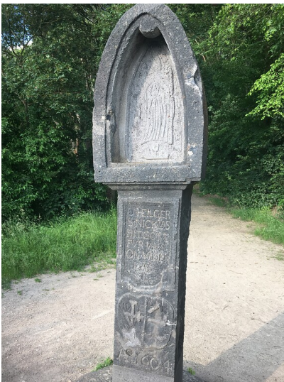
Nikolauskreuz am Ankerpfad bei Koblenz-Lay (2021).