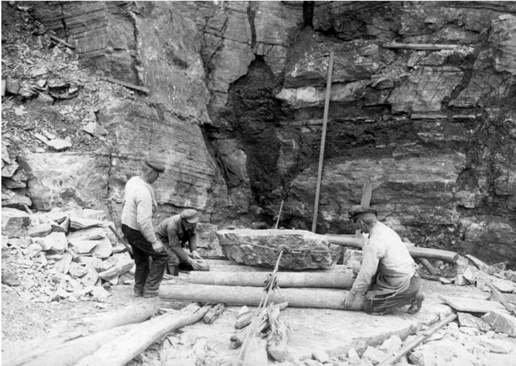
Historische Aufnahme der Arbeit im Wiedischen Steinbruch in Schubbach