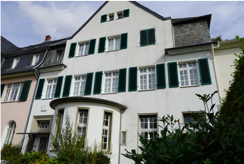
Die ehemalige Villa Konrad Adenauers und Familie in Köln-Lindenthal (2020). Fotograf/Urheber: Katharina Grünwald