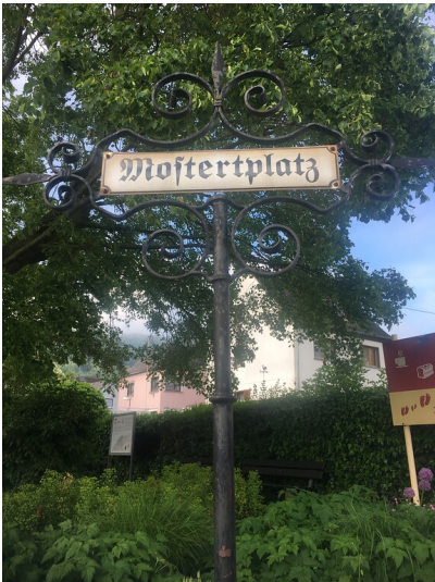
Mostertplatz in Koblenz-Lay (2021).