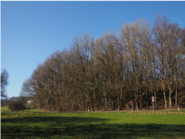
Blick über die Talau auf den verfüllten und bewaldeten ehemaligen Steinbruch Küppersbruch (2021)