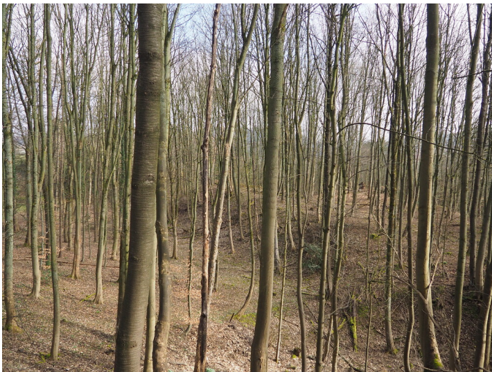
Steinbruch Velbert-Hefel (2021), bewaldete Schutthalde des Steinbruchs