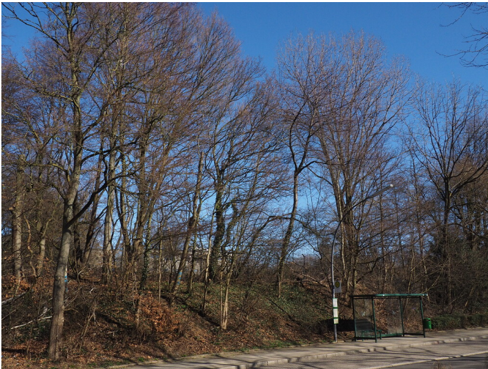
Steinbruch Velbert-Krehwinkel 2 (2021)