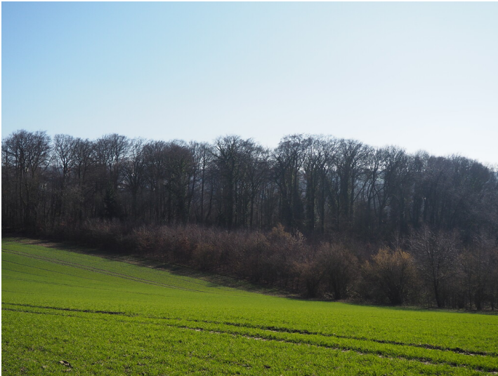
Blick von Norden über die Felder auf den heute bewaldeten ehemaligen Steinbruch Velbert-Krehwinkel (2021)