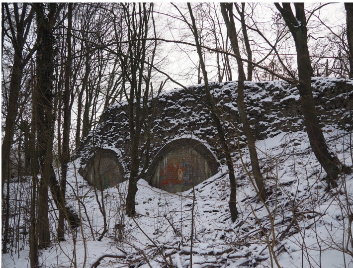
Ruine des Trichteralkofens Hammerstein (2021)