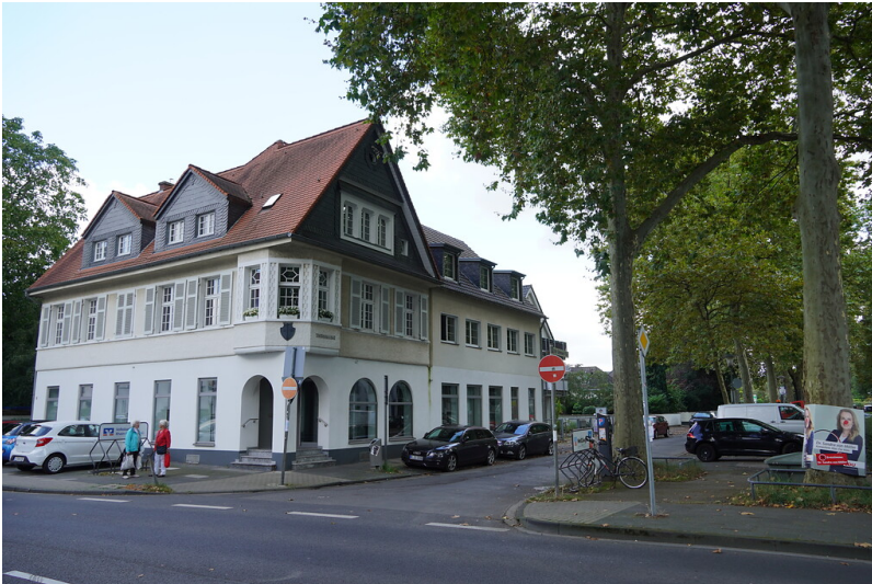
Blick auf ein historisches Gebäude an der Ecke Goethestraße / Emil-Schreierer Platz in Köln-Weiden (2021).