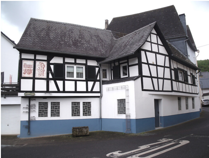
Koblenz-Lay (2021)