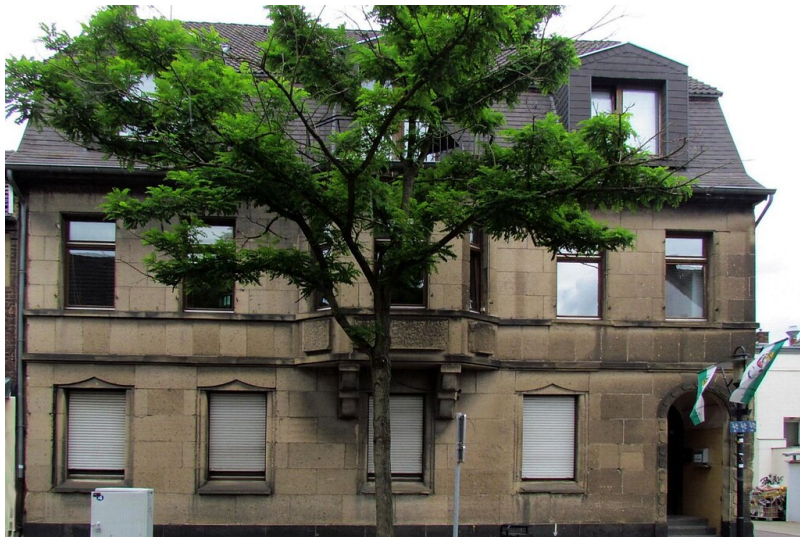
Das Wohnhaus Kölner Straße 127 in Dormagen, unter dessen Dach sich zwischen 1912 und 1938 die Betstube der jüdischen Gemeinde befand (Aufnahme 2011/12).