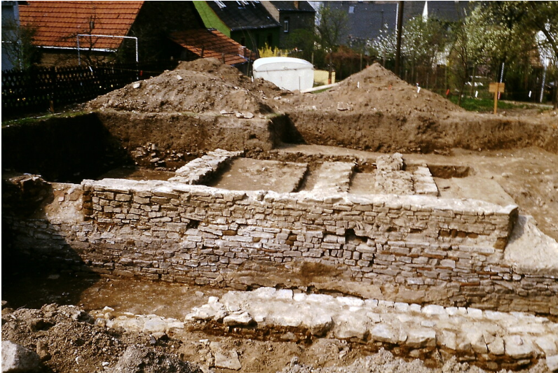
Reste einer römischen „villa rustica“ in Koblenz-Lay (1985)