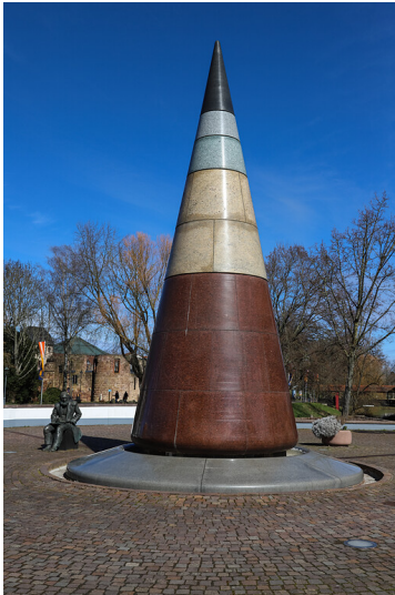
Bad Vilbeler UrQuelle Brunnen (2021)