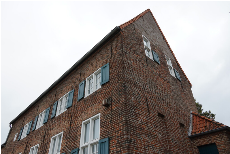
Das Museum Katharinenhof im ehemaligen Beginnen-Konvent, später Augustinerinnenkloster in Kranenburg (2021)