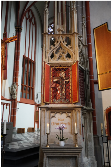
Kranenburger Kreuz (2021)