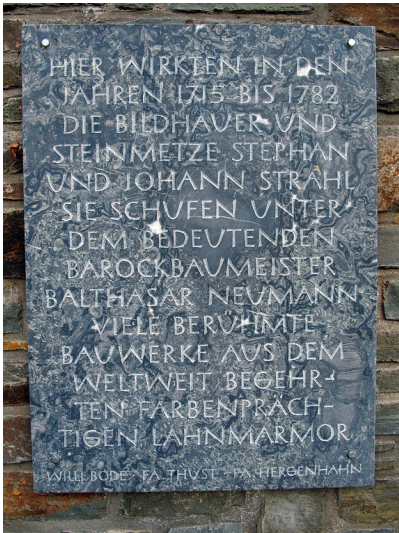
Gedenktafel der Steinmetzfamilie Strahl in Balduinstein (2020)