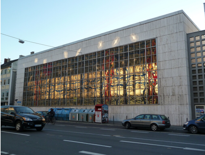
Fassade mit Kunstharzfenster des Viktoriabads am Bonner Belderberg (2013)