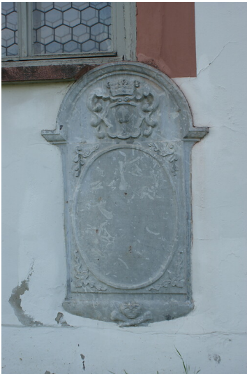
Epitaph in der evangelischen Kirche in Oberbiel (2020)