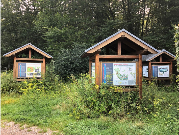
Informationstafeln zur Bockerter Heide (2021)