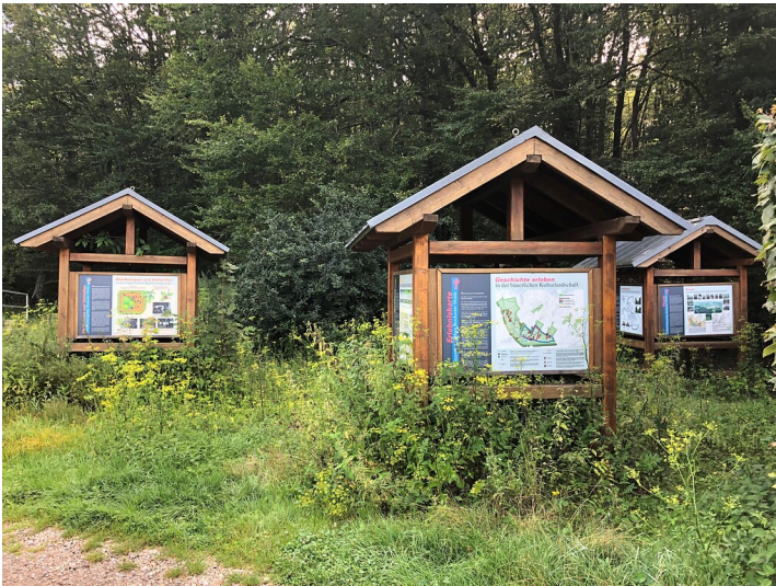
Informationstafeln zur Bockerter Heide (2021)