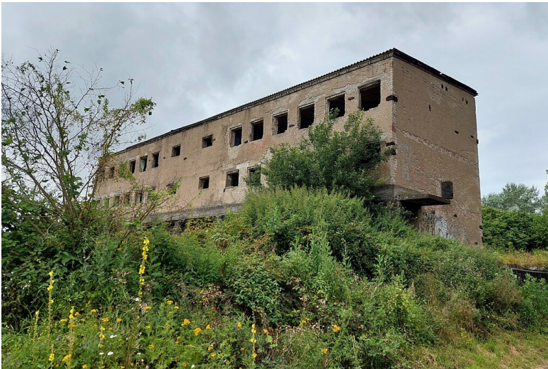
Die Ruine der früheren Heimschule am Laacher See bei Nickenich, Ansicht der Rückseite im Osten (2021).