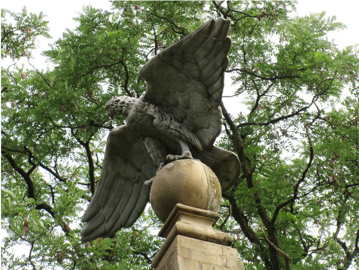
Aderfigur auf dem oberen Teil des Kriegerdenkmals an der Hurster Straße in Windeck-Rosbach (2021).