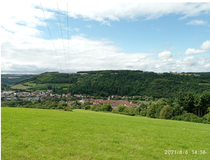
Odenbach am Glan (2021)