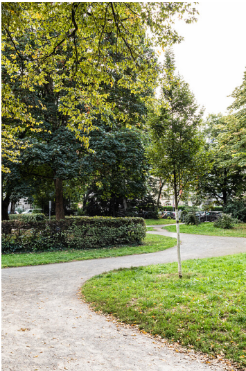
Leipziger Platz in Köln-Nippes (2021)