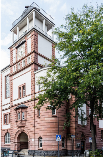
Leonardo-da-Vinci-Gymnasium in Köln-Nippes (2021)