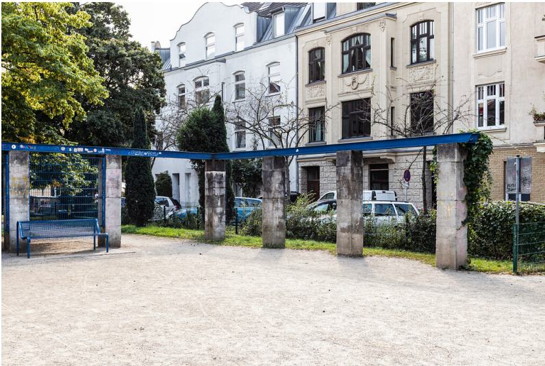
Der Erzbergerplatz in Köln-Nippes (2021)